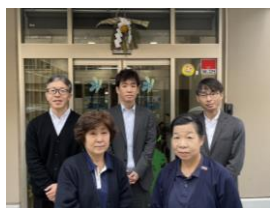
ドリームヒルズ滝山 居宅介護支援事業所

明けましておめでとうございます。 ドリームヒルズ滝山は開設より15年が経過しました。昨年の10月より法人理念を改めました。今年4月には介護報酬改定もごございますが地域に根差した老人保健施設を目指してまいります。 また、介護施設整備事業の一環として、特殊浴槽・介護ベッド離床キャッチ・眠りスキャンを導入致しました。今後も介護支援の電子機器の導入を計画して変化を続けたいと考えています。利用者様の最適・最良を求めて、私達介護職員がどうあるべきかを考えつつ少しでも理念に添える様に今年も頑張りますので宜しくお願い致します。